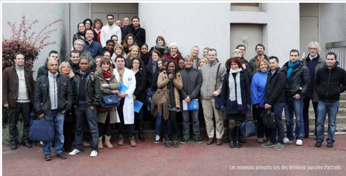
Les nouveaux arrivants lors des dernières journées d'accueil.

Direction de la Communication direction.communication@u-psud.fr