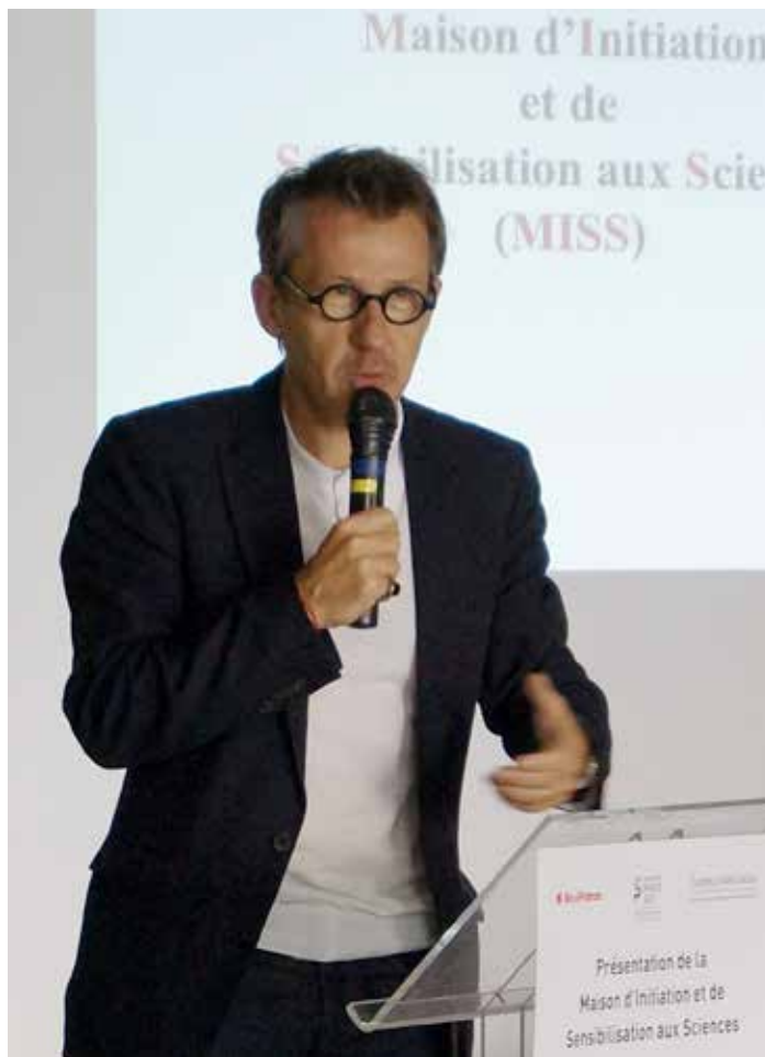
Jamy Gourmaud est l'un des deux prestigieux parrains de la MISS avec Wendelin Werner, Professeur de mathématique à l'Université Paris-Sud et lauréat de la médaille Fields 2006.